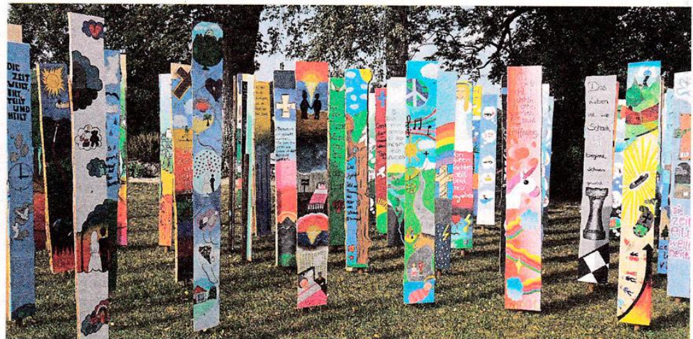
Auf dem Weg durch das Stelenlabyrinth in Miesbach können sich die Besucher in vielen Punkten selbst hinterfragen.

Sichtbares Zeichen dieser Zusammenarbeit sind die von 400 Schülern im Kunstunterricht bemalten Stelen zu den Themen Sterben, Tod und Trauer, ergänzt durch Zitate aus dem Unterricht.