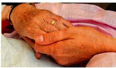
Hilfe auf dem letzten Weg: Einen sterbenden Menschen zu betreuen, ist eine anspruchsvolle Aufgabe.